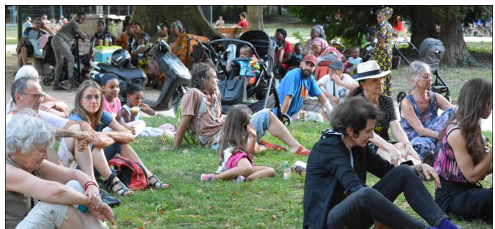
Ce premier concert, sous la Tour Perret, qui en amènera d'autres dans les mois à venir, a ravi les spectateurs.